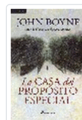
CASA DEL PROPOSITO ESPECIAL BOYNE