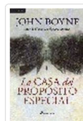
CASA DEL PROPOSITO ESPECIAL BOYNE