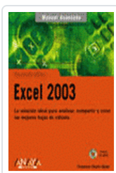
EXCEL 2003 MANUAL AVANZADO CHARTE, FRANCISCO