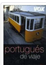
PORTUGUES DE VIAJE