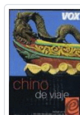
CHINO DE VIAJE