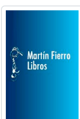
DONDE ESTA LA MARQUESA? (PQL 2) DE MIGUEL/SANTO