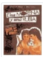
MORENA Y UNA RUBIA, UNA (PQL 3) DE MIGUEL/SANTO