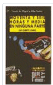
NOVENTA Y SEIS HORAS EN... (PQL 4)