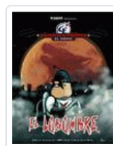
LOBOMBRE. CALICO ELECTRONICO. EL COMIX NIKODEMO