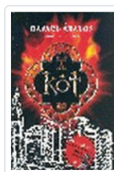
KOT ABALOS, RAFAEL