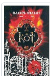
KOT ABALOS, RAFAEL