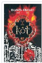
KOT ABALOS, RAFAEL