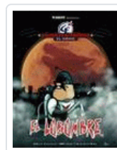
LOBOMBRE. CALICO ELECTRONICO. EL COMIX NIKODEMO