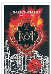
KOT ABALOS, RAFAEL