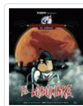
LOBOMBRE. CALICO ELECTRONICO. EL COMIC NIKODEMO