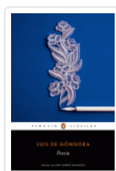
POESIA (GONGORA) GONGORA, LUIS DE