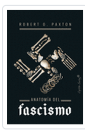
ANATOMIA DEL FASCISMO O, PAXTON, ROBERTO