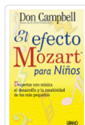
EFECTO MOZART PARA NIÑOS, EL DON CAMPBELL