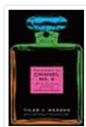
SECRETO DE CHANEL Nº5, EL MAZZEO,TILAR J