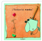
TODAVIA NADA? VOLTZ, CHRISTIAN