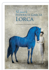
12 POEMAS DE FEDERICO GARCIA LORCA GARCIA, FEDERICO