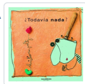
TODAVIA NADA? VOLTZ, CHRISTIAN