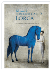
12 POEMAS DE FEDERICO GARCIA LORCA GARCIA, FEDERICO