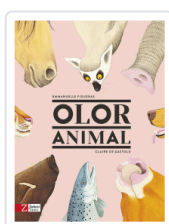
OLOR ANIMAL FIGUERAS, EMMANUELLE / DE GASTOLD, CLAIR