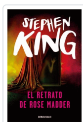
RETRATO DE ROSE MADDER, EL