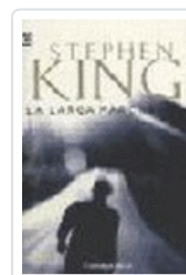
LARGA MARCHA, LA 102/19 KING, STEPHEN