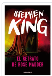
RETRATO DE ROSE Madder, EL