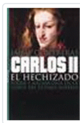
CARLOS II EL HECHIZADO CONTRERAS, JAIME