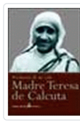
MADRE TERESA:MI VIDA POR LOS POBRES