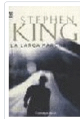
LARGA MARCHA, LA 102/19 KING, STEPHEN