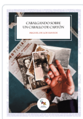
CABALGANDO SOBRE UN CABALLO DE CARTÓN DE LOS SANTOS, MIGUEL