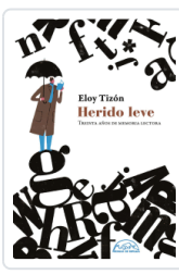
HERIDO LEVE TIZON, ELOY