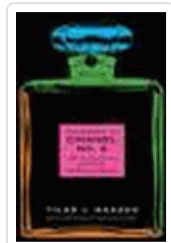
SECRETO DE CHANEL Nº5, EL MAZZEO,TILAR J