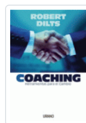
COACHING. HERRAMIENTAS PARA EL CAMBIO DILTS, ROBERT