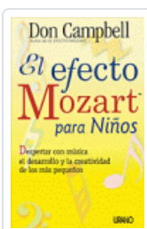
EFECTO MOZART PARA NIÑOS, EL DON CAMPBELL