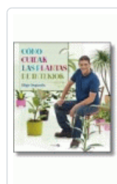
COMO CUIDAR LAS PLANTAS DE INTERIOR SEGURO IÑIGO