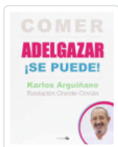
COMER Y ADELGAZAR ¡SE PUEDE! ARGUIÑANO KARLO