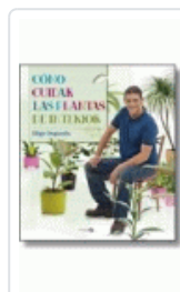
COMO CUIDAR LAS PLANTAS DE INTERIOR SEGUROLA IÑIGO