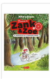
AVENTURAS DE ZANK & ZOE. EL MONSTRUO DE LA MONTAÑA NEGR VALVERDE, MIKEL