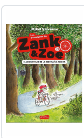
AVENTURAS DE ZANK & ZOE. EL MONSTRUO DE LA MONTAÑA NEGR VALVERDE, MIKEL