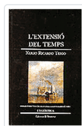
EXTENSIO DEL TEMPS (E.43) RICARDO, X.