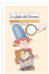
FADA DELS SOMNIS (MG.91) VIANA, MERCE