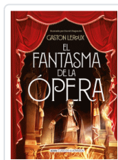
FANTASMA DE LA OPERA, EL LEROUX, GASTON