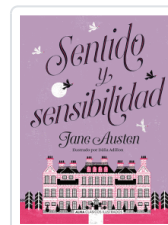
SENTIDO Y SENSIBILIDAD AUSTEN, JANE