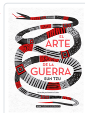
ARTE DE LA GUERRA, EL SUN-TZU