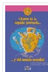
CHISTES DE LA ESPAÑA PROFUNDA... VOL II MUÑOZ RUBIO, ANA M ª