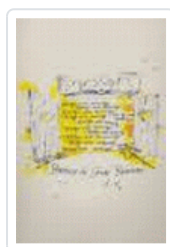
TENGO UN AMIGO