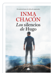
SILENCIOS DE HUGO, LOS CHACÓN, INMA