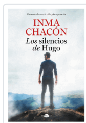
SILENCIOS DE HUGO, LOS CHACON, INMA