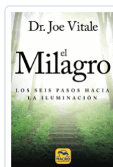
MILAGRO, EL VITALE, JOE