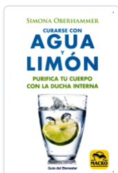
CURARSE CON AGUA Y LIMON OBERHAMMER, SIMONA