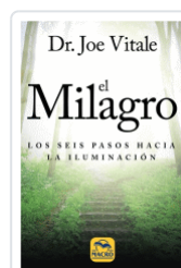
MILAGRO, EL VITALE, JOE