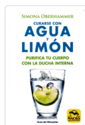
CURARSE CON AGUA Y LIMON OBERHAMMER, SIMONA