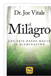
MILAGRO, EL VITALE, JOE