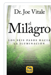
MILAGRO, EL VITALE, JOE