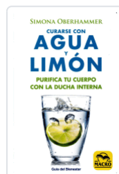
CURARSE CON AGUA Y LIMON OBERHAMMER, SIMONA