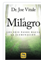
MILAGRO, EL VITALE, JOE