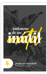
ANDANZAS DE UN INUTIL VON EICHENDORFF, JOSEPH