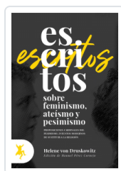
ESCRITOS SOBRE FEMINISMO, ATEISMO Y PESIMISMO VON DRUSKOWITZ, HELENE