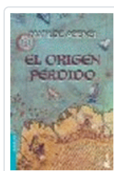
ORIGEN PERDIDO (NF) MATILDE ASENSI