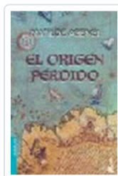
ORIGEN PERDIDO (NF) MATILDE ASENSI