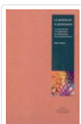
APUESTA POR LA GLOBALIZACION GOWAN