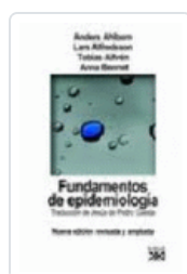
FUNDAMENTOS DE EPIDEMIOLOGIA AHLBOM, ANDERS