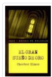
GRAN SUEÑO DE ORO