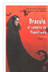
DRACULA, EL VAMPIRO DE TRANSILVANIA JUAREZ, JORGE M.