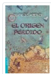
ORIGEN PERDIDO (NF) MATILDE ASENSI