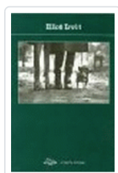
ELLIOT ERWITT POTOPOCHE PHOTOPOCHE