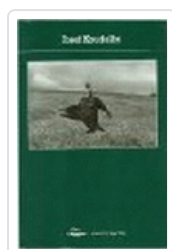
JOSEF KOUDELKA PHOTOPOCHE