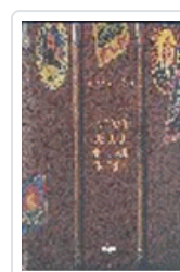
EDAD DE ORO DEL VIAJE EN TREN, LA AA.VV.