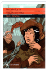
MARCABRU Y LA HOGUERA DE HIELO (CUATROVIENTOS) TEIXIDOR, EMILI