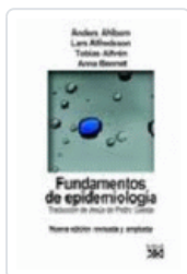
FUNDAMENTOS DE EPIDEMIOLOGIA AHLBOM, ANDERS