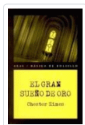
GRAN SUEÑO DE ORO