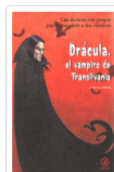
DRACULA, EL VAMPIRO DE TRANSILVANIA JUAREZ, JORGE M.