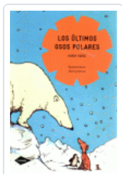
ULTIMOS OSOS POLARES, LOS (COMETA) HORSE, HARRY