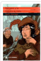
MARCABRU Y LA HOGUERA DE HIELO (CUATROVIENTOS) TEIXIDOR, EMILI