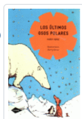
ULTIMOS OSOS POLARES, LOS (COMETA) HORSE, HARRY