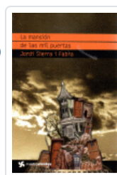
MANSION DE LAS MIL PUERTAS, LA (CUATROVIENTOS) SIERRA I FABRA, JORDI