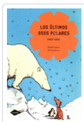
ULTIMOS OSOS POLARES, LOS (COMETA) HORSE, HARRY