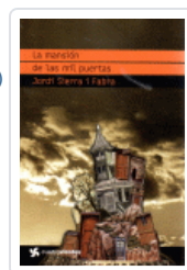
MANSION DE LAS MIL PUERTAS, LA (CUATROVIENTOS) SIERRA I FABRA, JORDI